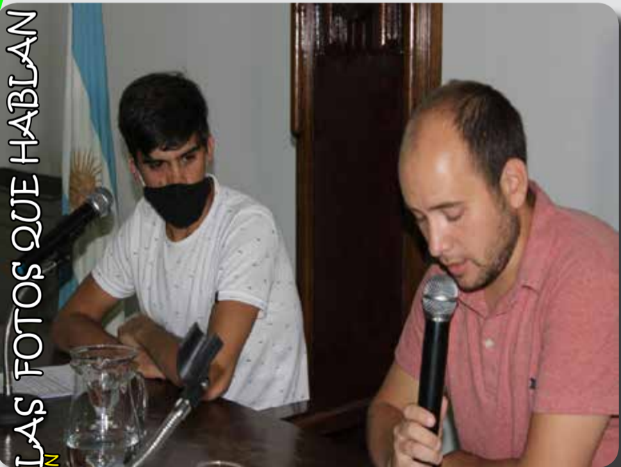
LAS FOTOS QUE HABLAN