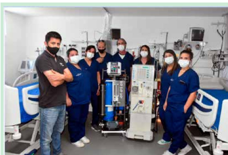
El Hospital Municipal 'Dr. Alberto Castro' incorporó equipamiento para realizar diálisis