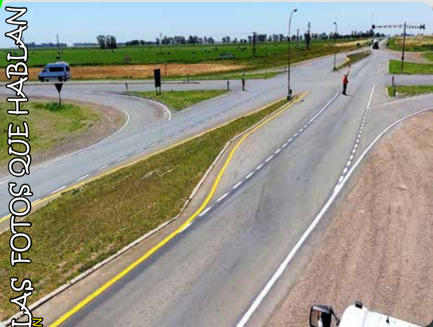
LAS FOTOS QUE HABLAN