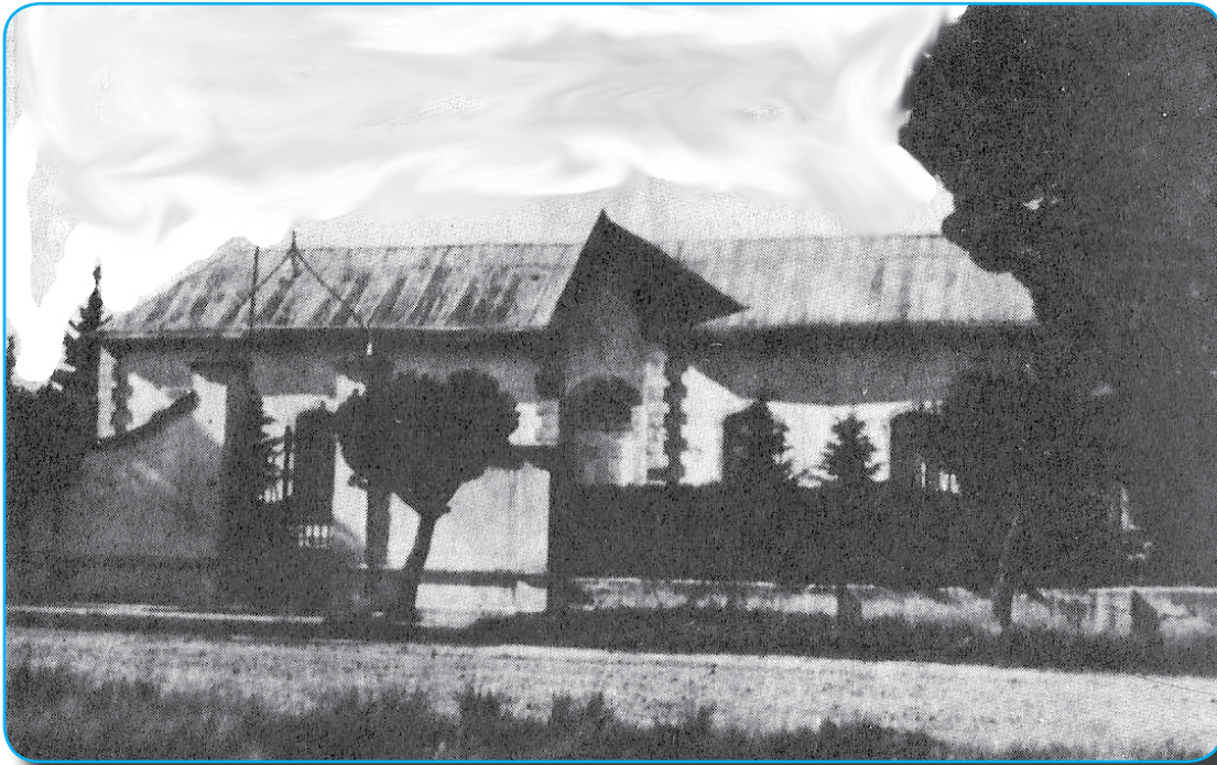
Sanatorio y Sala Maternal, mandada a construir por el Comisionado Municipal en el año 1909, Senador Nacional Manuel Lainez. Demolida en agosto de 1982

“Construyamos el futuro sin destruir el pasado”