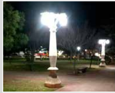
Instalación de luminarias led en Saldungaray