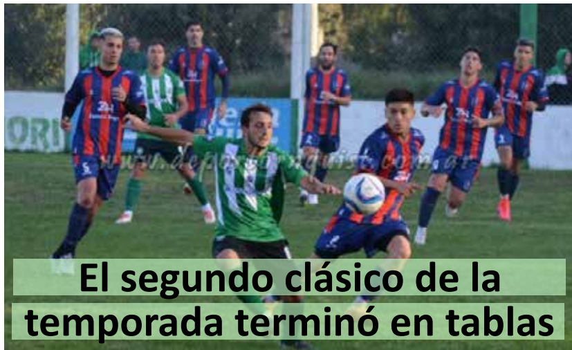
El segundo clásico de la temporada terminó en tablas