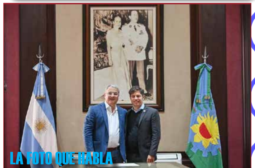
LA FOTO QUE HABLA

distintas localidades del distrito y dijo que hubiese preferido una elección interna para definir al candidato que represente al centenario partido en las PASO., pero ya no habría tiempo... veremos. veremos. veremos..