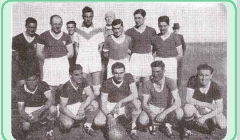
Otra de las instituciones que al fusionarse hizo posible la formación del Club Unión, el Club Sierras Cultural y Deportivo.

Este es otro de los clubes con los cuales se formó el actual Club Unión.