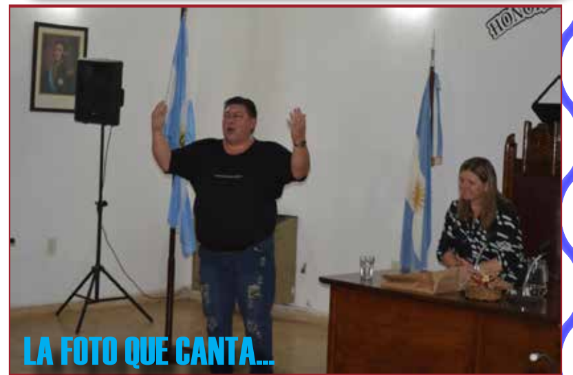
LA FOTO QUE CANTA...