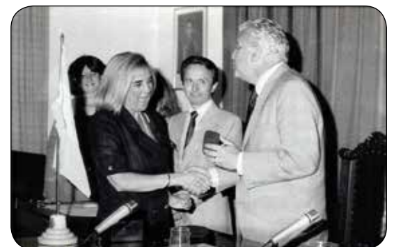
1987: El gobernador Antonio Cafiero distingue a Marisa Kugler por ser la primer intendente mujer de la Provincia de Buenos Aires