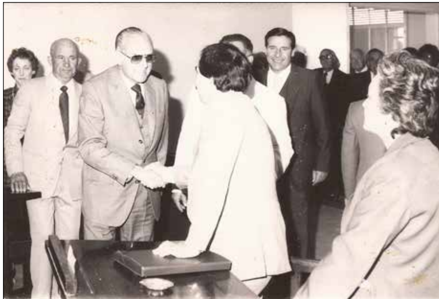
1985: El gobernador Alejandro Armendariz es recibido en el recinto del Honorable Concejo Deliberante (hoy sala de situaciones)

El 30 de Octubre de 1983 se realizaron luego de la Dictadura Militar de 1976, las elecciones que marcaron el regreso de la democracia hasta nuestros días.