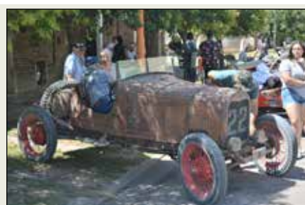
Baquets y autos antiguos dejaron su huella en Tornquist