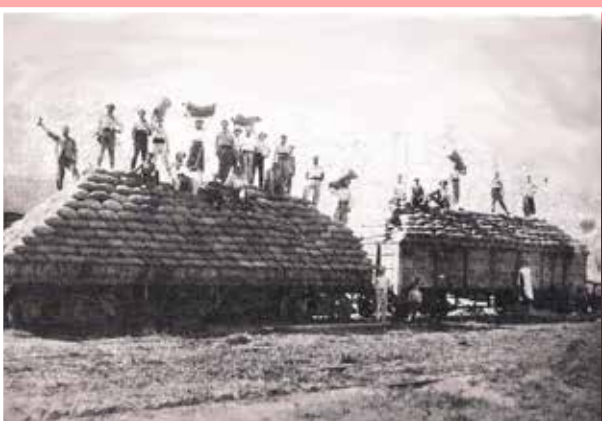
Apuntes de un pasado imborrable "La Vieja Estación" (parte II)