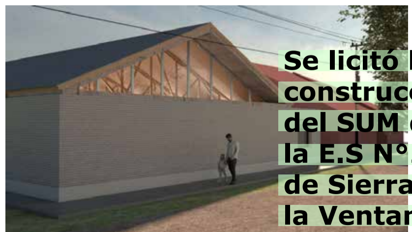
Se licitó la construcción del SUM de la E.S N°2 de Sierra de la Ventana