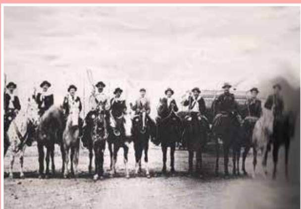
Apuntes de un pasado imborrable "Los últimos desfiles a caballo"

En el clásico más lindo de la LRF, Unión recibía en el "Bosque" a Automoto. Como es costumbre la fiesta la pusieron las hinchadas