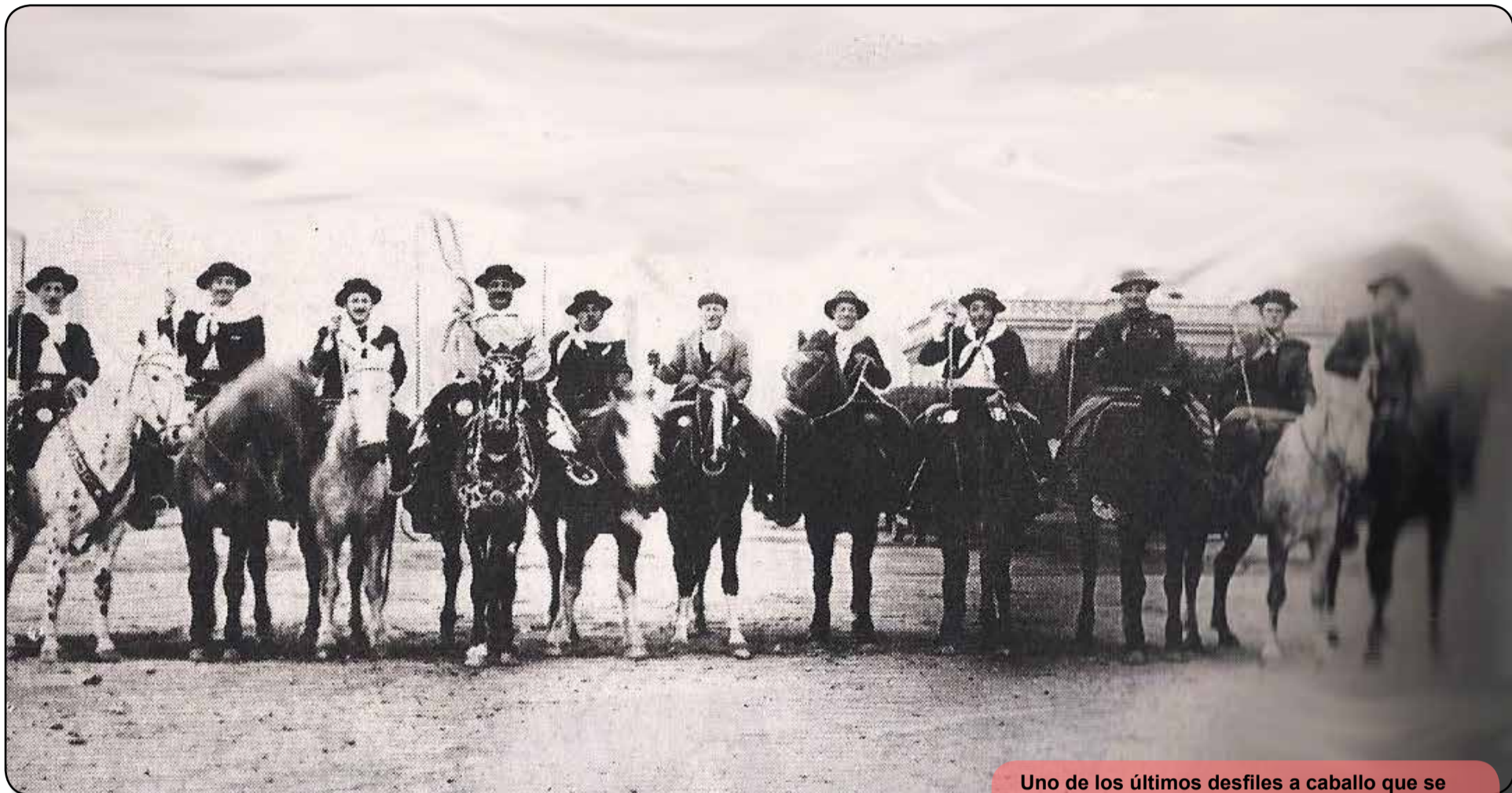
Uno de los últimos desfiles a caballo que se realizaron en Tornquist

H ace ya largos años que no se hacen desfiles a caballos, como en otras épocas lejanas, cuando lo hacían nuestros hombres criollos en los días de fiesta patria y, principalmente, el Día de la Tradición.