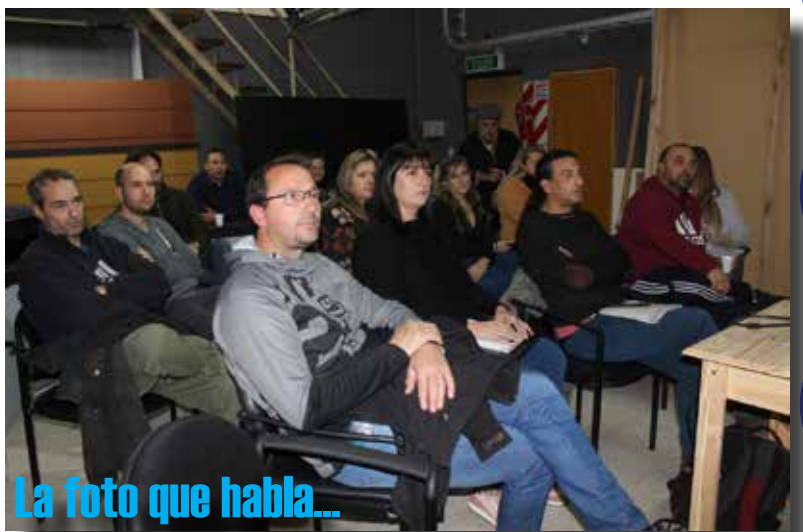
La foto que habla...

En el terreno eleccionario la historia cuenta que en mas de una