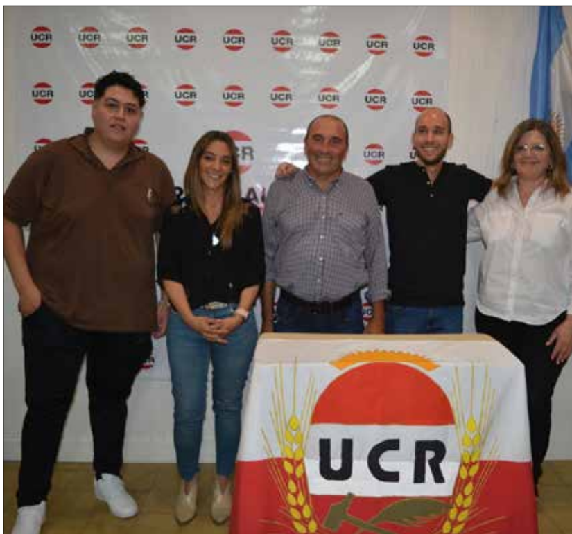
La UCR de Tornquist presentó a sus autoridades partidarias