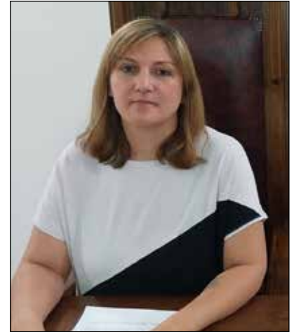
Enojo de los vecinos y la influencia de las redes

"Esperemos que todo transcurra con tranquilidad, ya que hemos atravesado días bastante tensos. Por suerte, hoy no se llegó a situaciones críticas."