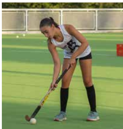
Cabe resaltar que la disciplina se encuentra abierta a todas aquellas niñas y jóvenes que quieran sumarse, sin importar la edad y la experiencia.

Participan las categorías competitivas Sub 14 (2011-2012), Sub 16 (2009 - 2010) y Primera (2008 en adelante), y a partir de la próxima semana se sumarán las jugadoras pertenecientes a Sub 12 (2013 - 2014).