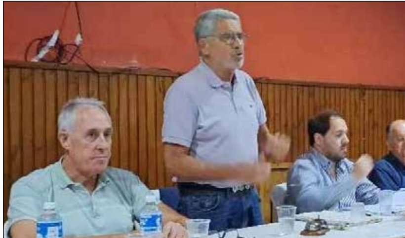
A. Huanguelén vs. Puan F. Club Libre: Tiro Federal (Puan)

Racing Club vs. Club Sarmiento Peñarol (P) vs. San Martín (Carhué)