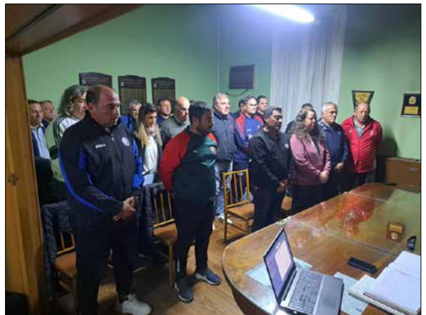
Fútbol Bonaerense Pampeana.