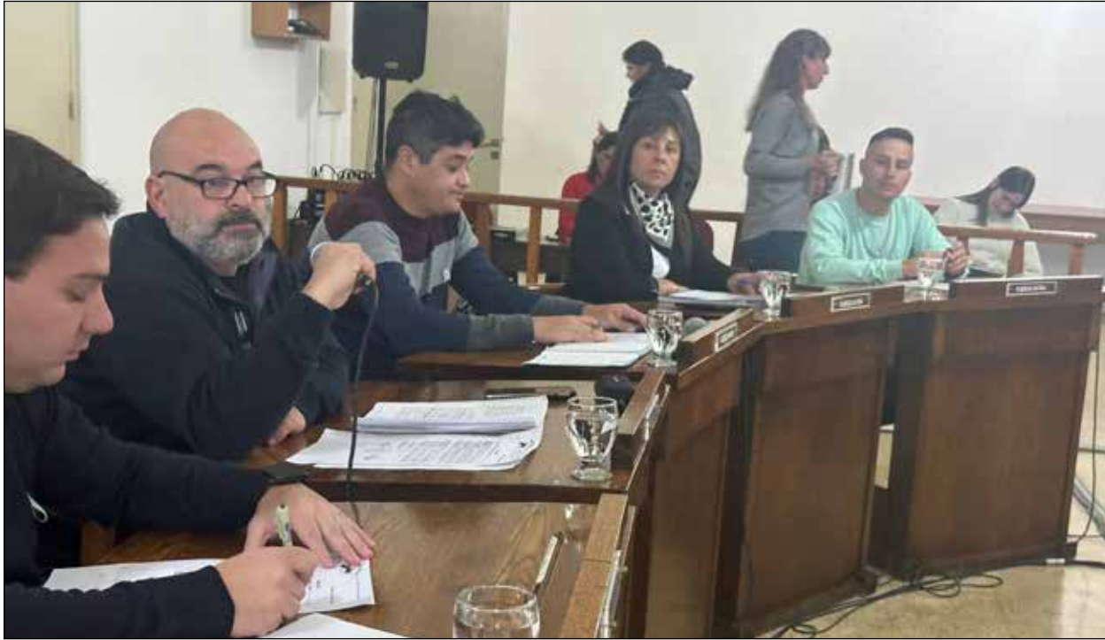
Se aprueba por unanimidad la renuncia. Alocuciones de los Concejales: