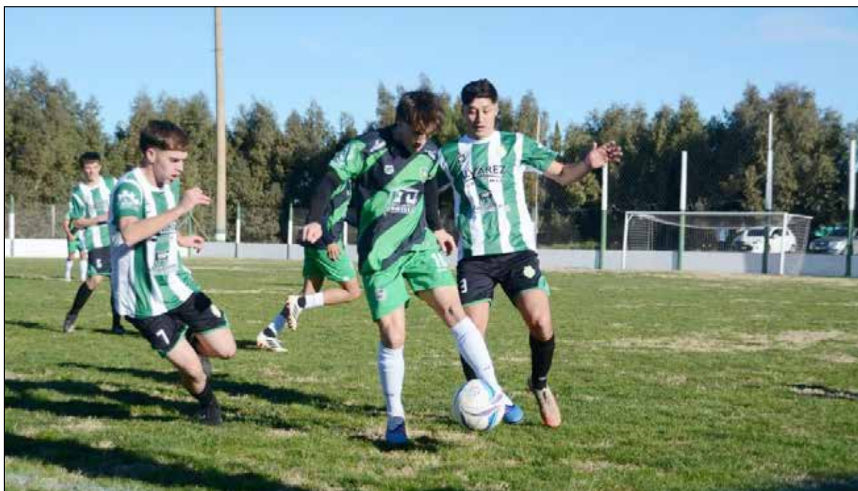
Fútbol de Coronel Suárez.

Al jugarse este domingo la decimotercera y última fecha de la etapa preliminar, quedaron definidos los cuatro clubes que completaron el cuadro de clasificados para los octavos de final del torneo Apertura de Primera masculino de la Liga Regional de